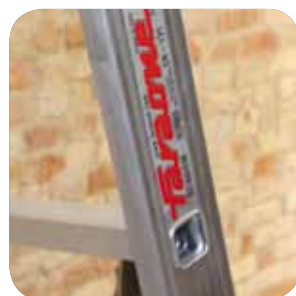
Sprossen / Trin / Trinn 30 x 30 mm