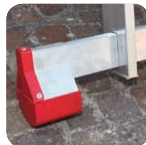
Neue Standtraverse Ny stabiliser - stigeod. Ny stabiliserende stigeod.