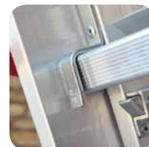
Spezieller Einrasthaken Vorrichtung. Stålvire mellom stigeledene. Spesiell innretning som sikrer mot at stigen ikke faller sammen.

NEU OPTIONAL GR80 Optional: Möglich ist eine Montage von extra breiten Stufen 8 cm - in der Oberleiter, auf bestellung. NYHED EKSTRAUDSTYR Mulighed for montering af brede trin - 8 cm - på det udtrækkelige stigeelement. NYHED OPSJONELT Mulighet for montering av brede trinn - 8 cm - på den utskyvende delen av stigen.