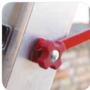
Starre Verbindung. En special wire, der beskytter mod udskridning. Spesiell innretning som sikrer mot at stigen ikke faller sammen.