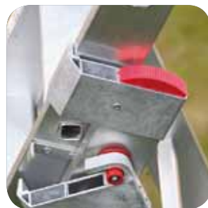
Kann auch problemlos auf Treppen aufgestellt werden. Må gerne oppstilles på trapper. Kan brukes på trapper.